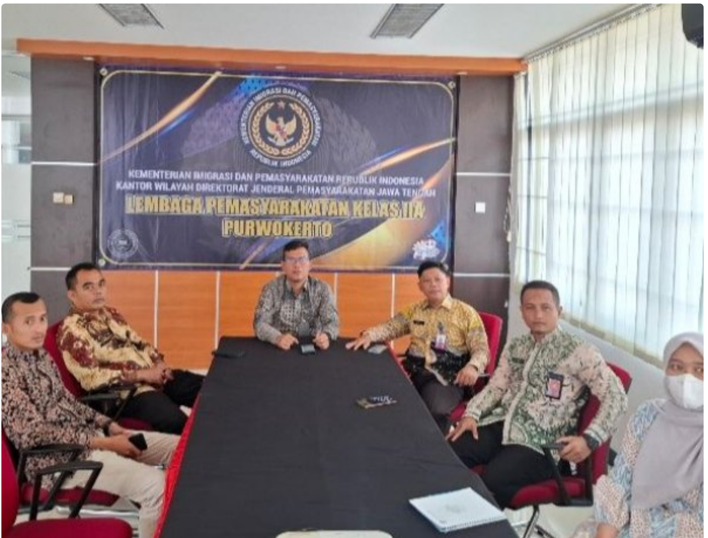
Lapas Kelas IIA Purwokerto Ikuti Entry Meeting Pemeriksaan BPK RI Atas Laporan Keuangan Kementerian Hukum dan HAM Tahun 2024 secara Virtual

PURWOKERTO - Lembaga Pemasyarakatan (Lapas) Kelas IIA Purwokerto mengikuti Entry Meeting Pemeriksaan atas Laporan Keuangan Kementerian